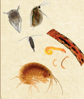
Tema söök noorelt: